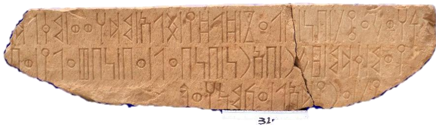
لوحة ٤: (الشرعي كمنا ٤)