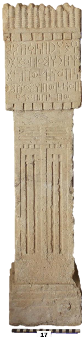
لوحة ١ : (الشرعي: كمنا ١)