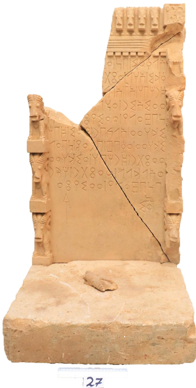
لوحة ٢ : (الشرعي: كمنا ٢)